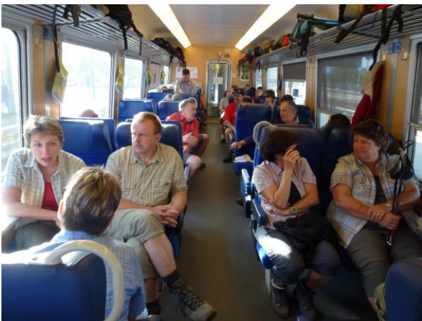
Mit weiteren Wandergruppen lassen wir uns von der SBB ins Wallis gondeln.

Nachdem wir uns von den magischen Blicken der typischen Lötschentaler Holzmaske befreit haben, passieren wir die Kontrollschranke der Lauchernalp-Luftseilbahn und betreten darauf die Grossraumkabine. Als die zugelassenen Personen an Bord sind, zieht uns ein kräftiger Motor der warmen Sonne entgegen.