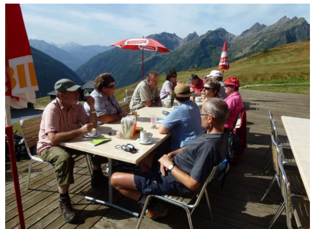
Im Hotel Bärgsunna stärken wir uns vor der Wanderung mit Ovo und kräftigem Kaffee.