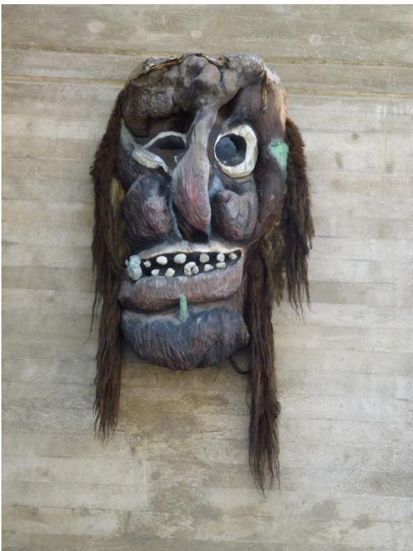
In Wiler erwarten uns grimmige, aber dennoch vertraute Gestalten.