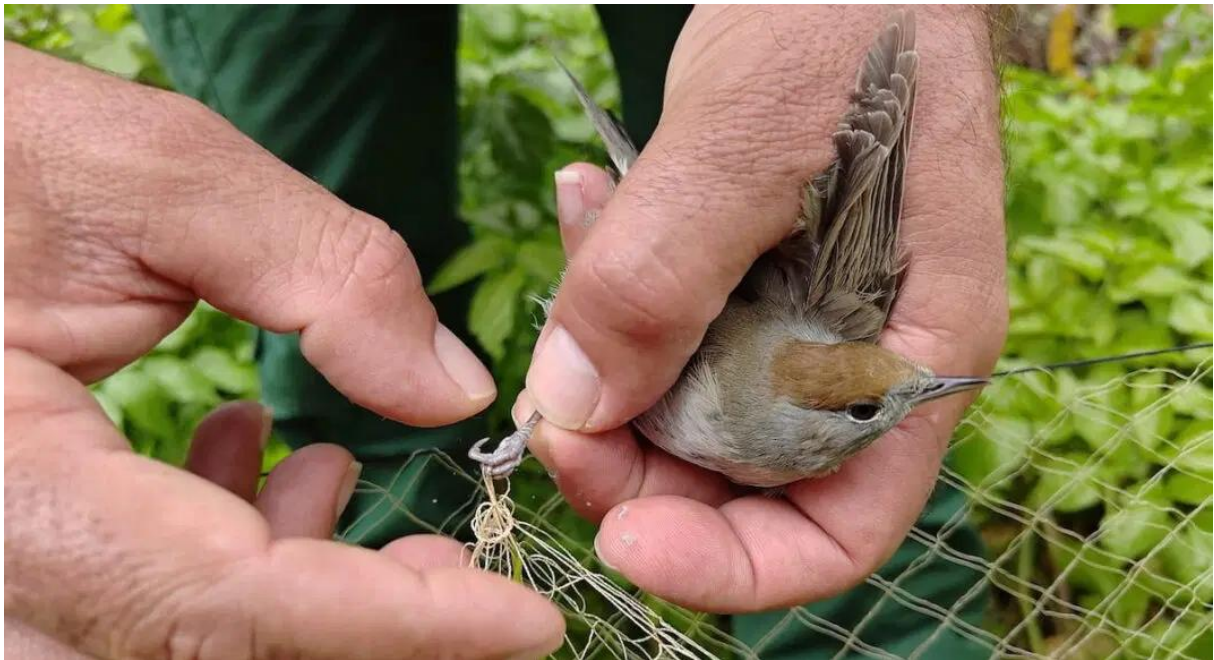
Mönchsgrasmücke ♀ wurde im Frühjahr 2026 im Rahmen des Frühjahrs-Vogelschutzcamps auf Zypern befreit.