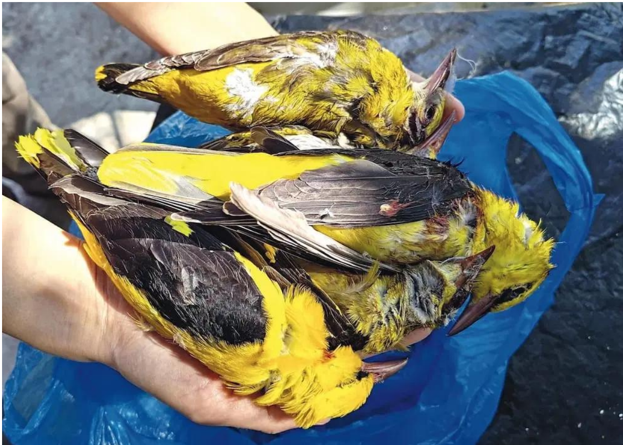
Auf Zakyntos im Frühjahr illegal abgeschossene Pirole.

Der Vorfall fand in mehreren Ländern ein breites Medienecho und erhöhte den Druck auf die lokalen Behörden – gerade im Vorfeld der Tourismussaison. In der Folge wurden umgehend erste Massnahmen ergriffen und Polizeiverstärkung vom Festland war schon am Folgetag nach dem gewalttätigen Vorfall vor Ort.