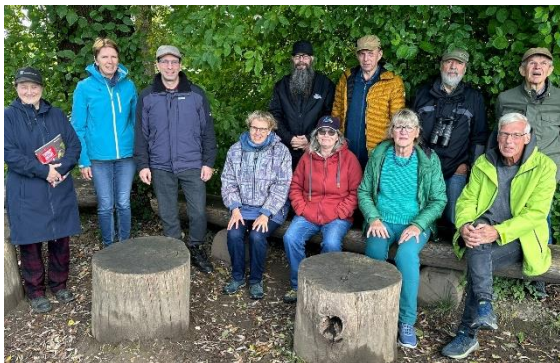
Herbstexkursion gemeinsam mit dem NVV Halten

Danach haben wir im Landgasthof „Zum Wilden Mann“ in Neerach zu Mittag gegessen und den Tag ausklingen lassen.